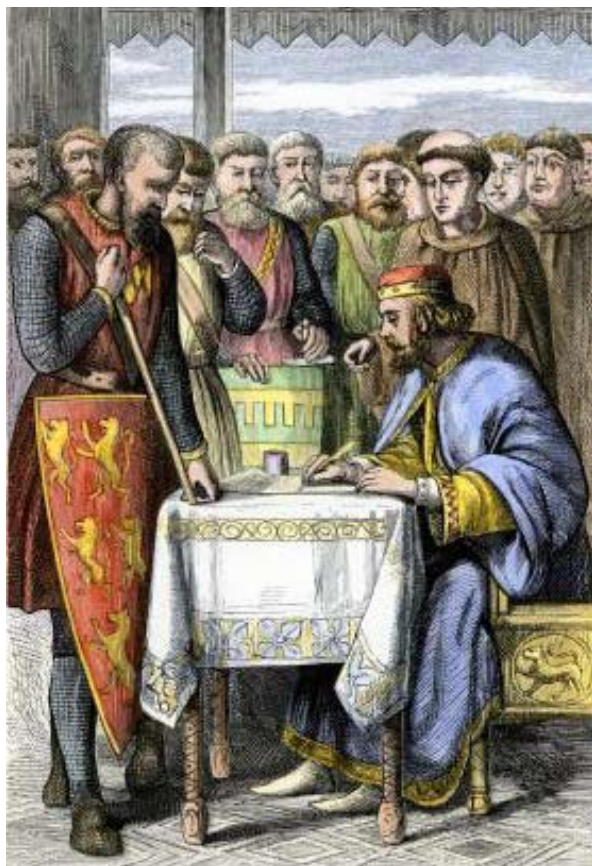
Kung John signerar Magna Charta den 15 juni 1215. En färglagd trägravvyr från 1800-talet som finns på The Granger Collection i New York.

också från 1297, finns i USA dit det såldes för över 22 år sedan från en privat samling i England. Sedan dess har det bytt ägare och hamnat hos Perot Foundation som ansåg att de behövde pengar för andra ändamål och därför lät Sotheby's sälja dokumentet i oktober 2007. Exemplaret blev kvar i USA och kan beskådas på the National Archive i Washington DC, där det varit utställt sedan det kom till USA. Den nye ägaren fick betala 21,3 miljoner amerikanska dollar, vilket är cirka 140 miljoner svenska kronor – vem sa